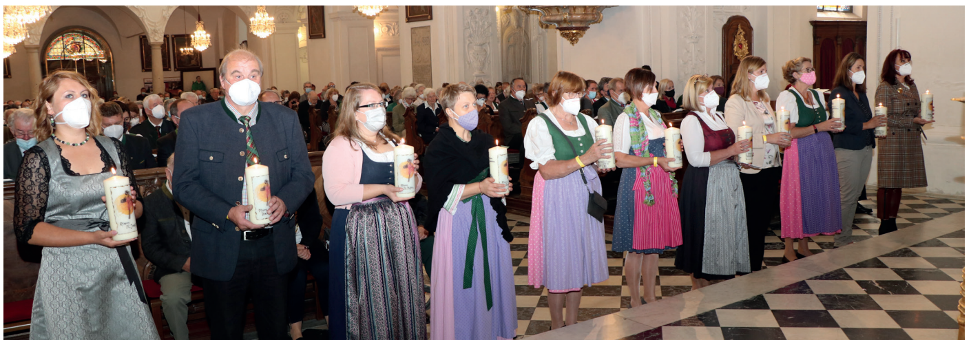
Vertreterinnen und Vertreter aus den elf Pfarren beim Startgottesdienst 2021